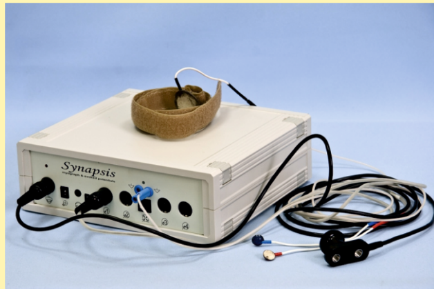
Анализатор электронейромиографический «Синапсис»

Четырехканальный полнофункциональный электромиограф «Синапсис» позволяет проводить все исследования мышц и проводимости нервов, также проводить исследования вызванных потенциалов, а также в стоматологии.