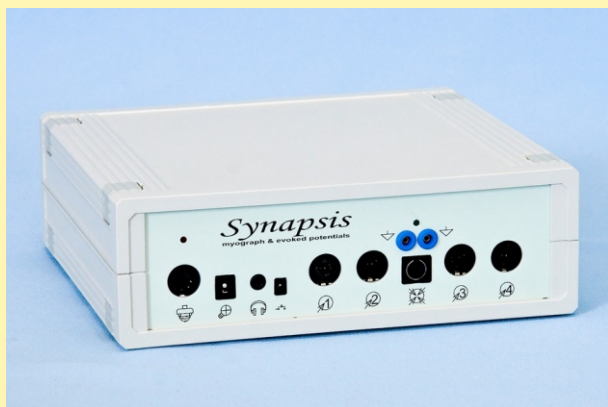
Система психофизиологического тренинга методом биологической обратной связи «Кинезис»

Комплексная система биологической обратной связи - это современная система психофизиологического тренинга и коррекции разнообразных функциональных расстройств при широком спектре заболеваний нервной, опорно-двигательной и сердечно-сосудистой систем организма, а также при психоэмоциональных расстройствах. Коррекция расстройств внимания и сна, устранение страхов, фобий, неврозов. Выработка навыков стрессоустойчивости. Реабилитация парезов, последствий инсульта или инфаркта.